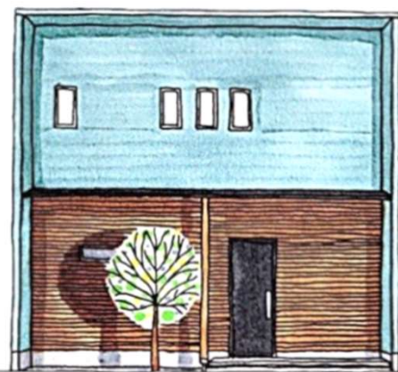
※イメージパースです。